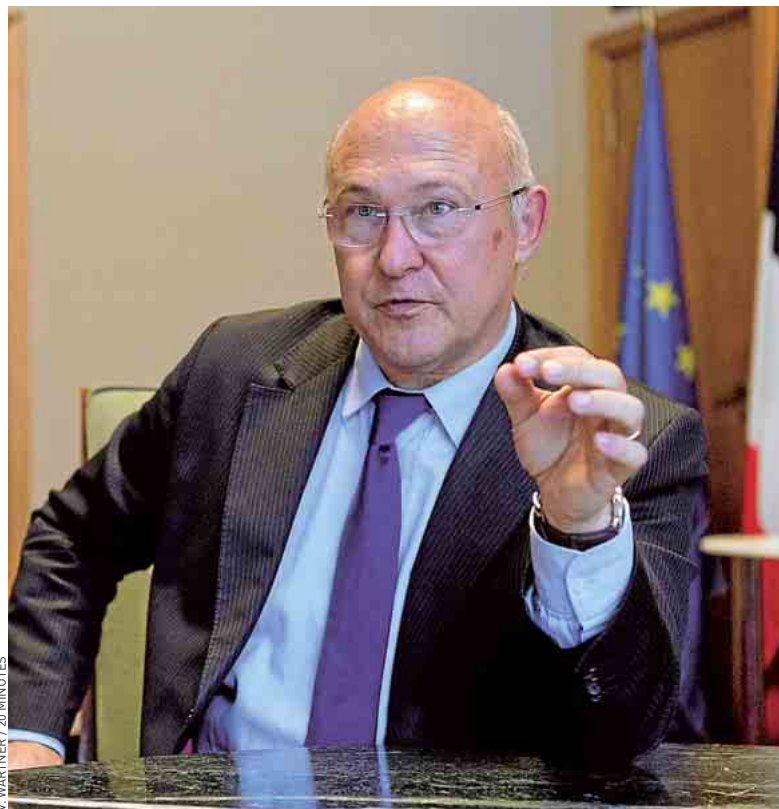
Le ministre Michel Sapin vise 100 000 contrats d'avenir en 2013.

fondement déstabilisé le service public et leurs agents ».