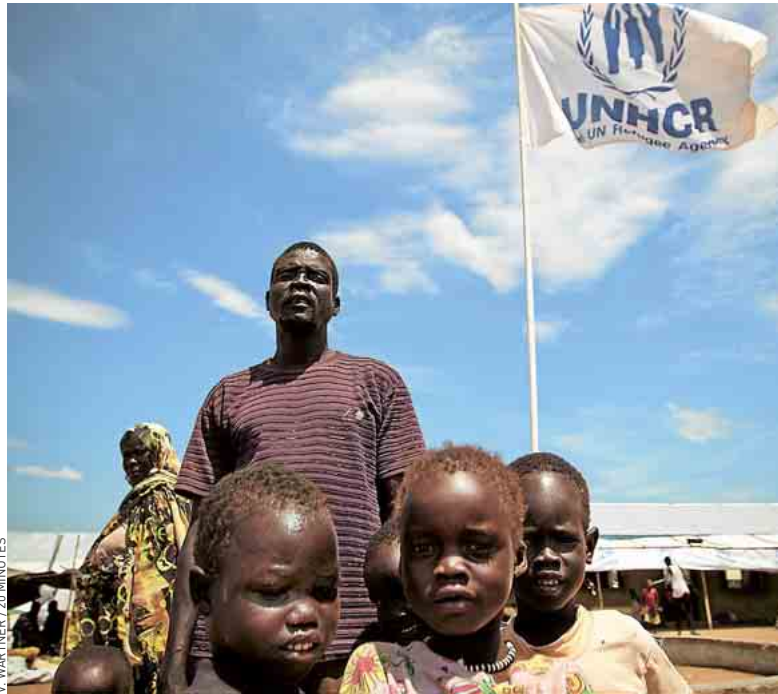
A Juba, 1 600 « retournés » survivent dans un camp de transit.

Selon l'Organisation internationale pour les migrations (IOM), il y aurait encore 350 000 à 500 000 Sud-Soudanais au Nord. Dont 75 à 80 % à Khartoum. Si certains d'entre eux ne veulent pas forcément partir, d'autres ne le peuvent tout simplement pas. La frontière s'est fer-