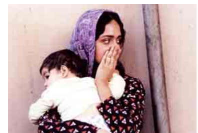
Les Enfants de Belle Ville.