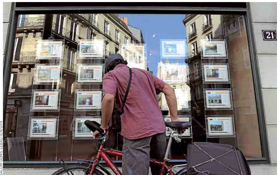
Comparez les prix de l'appart de vos rêves avec ceux d'autres biens en vente dans le quartier.