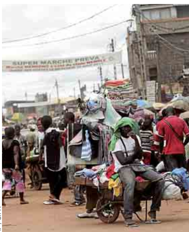
L'enseignant français a été tué à l'arme blanche à Yaoundé (photo).

Après dix-huit ans de négociations, la Russie sera le 156 e pays à adhérer à l'Organisation mondiale du commerce (OMC). Les députés de la Douma d'Etat ont ratifié mardi cette adhésion qui sera effective dans trente jours.