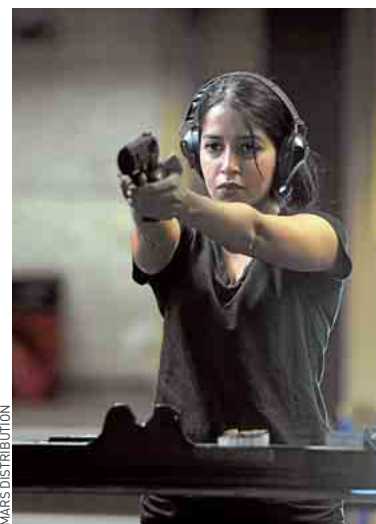
Leïla Bekhti incarne une jeune flic.