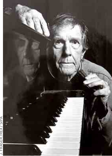
Le compositeur américain, en 1989.