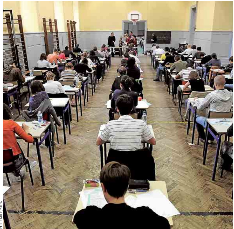
En 2011, 409 candidats ont été suspectés de triche et 250 ont été sanctionnés.

Pour empêcher la triche, un texte précisant les conditions de sortie des salles d'examen et rappelant les sanctions encourues leur sera désormais lu avant les épreuves. Autre nouveauté de taille : des détecteurs de portables seront expérimentés cette année dans certains centres d'examens. Ils seront capables de détecter les ondes émises par les téléphones dans un périmètre de 10 à 20 mètres. Mais Jean-Michel Blanquer, directeur général de l'enseignement scolaire, refuse de préciser combien d'appareils seront déployés. « C'est le principe de la dissuasion, a-t-il déclaré