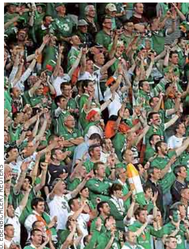
Les fans irlandais, à Poznan.