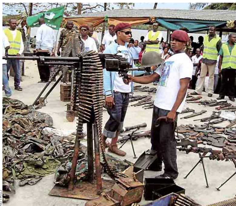
Plus de 2 000 personnes sont tuées chaque jour par la violence armée, selon les chiffres du secrétariat de la Déclaration de Genève en 2011.

Alors que le commerce des armes classiques est soumis à une réglementation nationale dans trente-cinq pays, les associations réclament plus de transparence, en matière d'équipement lourd (chars d'assaut), comme en matière d'armement plus léger (petits calibres). Avec un argument : le manque de réglementation crée les conditions pour les