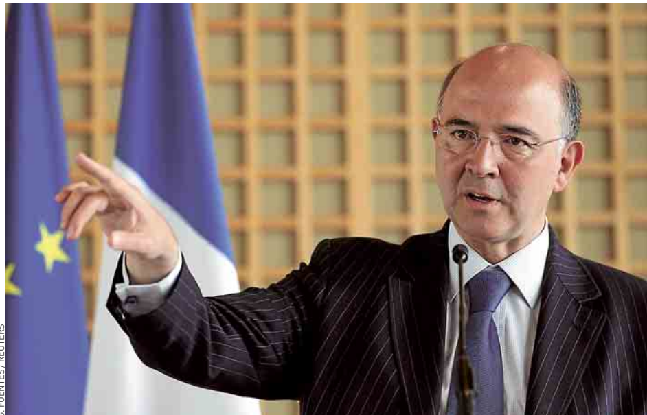
Selon le ministre de l'Économie, Pierre Moscovici, une vingtaine de dirigeants sont concernés.

Pierre Moscovici souhaite également voir appliquer cette « exigence de modération et de justice pour les entreprises où l'État est actionnaire minoritaire », comme GDF Suez, Renault ou Air France-KLM. Reste que la décision du gouvernement ne s'attaque pas aux rémunérations accessoires, comme les parachutes dorés, les retraites chapeaux ou encore les primes de non-