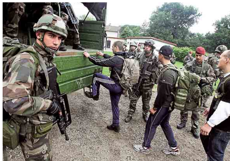
Les parachutistes ont sauté sur l'aérodrome des Pujols, à Pamiers. Ils ont pénétré dans leur zone cible avant d'en exfiltrer de pseudo-expatriés en danger.

DÉFENSE Guerre civile dans un pays imaginaire, mais vraie répétition pour les paras de la région