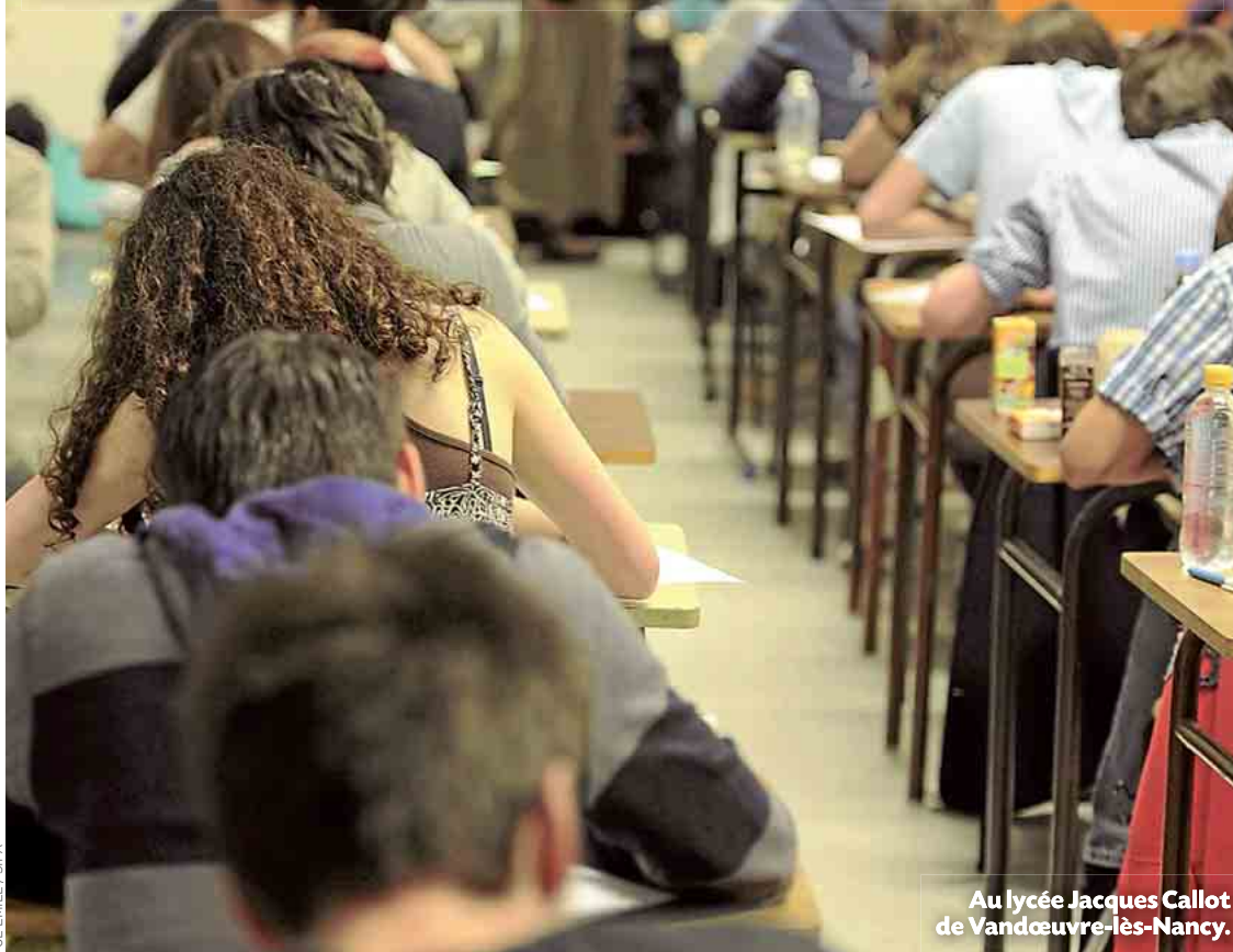
Au lycée Jacques Callot de Vandœuvre-lès-Nancy.

Pour ne pas répéter le fiasco de la session 2011 entachée par des fuites, le ministère de l'Education nationale a dévoilé des mesures pour lutter contre la fraude à l'examen, qui commence demain aux Antilles et en Guyane et lundi en métropole. P.8