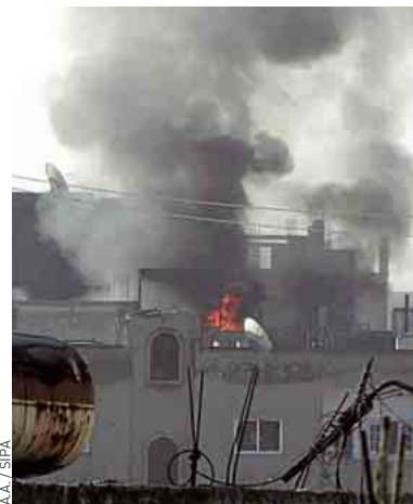
Trente-cinq personnes seraient mortes à Homs, dimanche.

Il y a quelques semaines, depuis la ville américaine de Chicago qui accueillait le sommet de l'Otan, François Hollande nouvellement élu avait expliqué les modalités de retrait de la France, avant l'échéance prévue de fin 2014. L'Otan est, elle, décidée à mener jusqu'à la fin 2014 des missions de soutien à l'armée afghane.