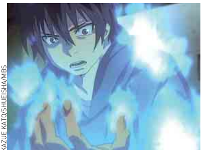
Gentil démon dans une série d'enfer.