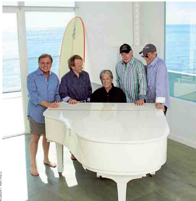
Les Beach Boys de retour pour fêter leurs 50 ans de carrière.