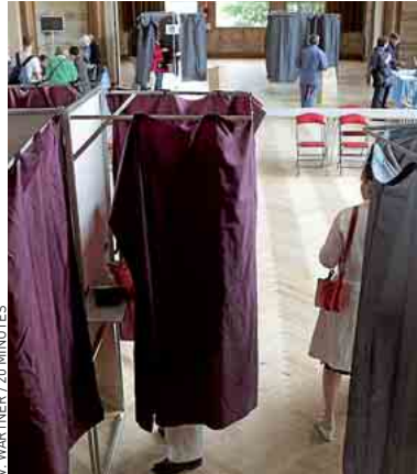
A Paris, bureau de vote du 14°.

L'UMP et ses alliés peuvent espérer entre 210 et 263 sièges. « Il n'y a pas de