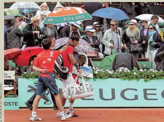
La finale reprendra ce lundi à 13 h.

marquera définitivement l'histoire du jeu. Nadal cherche un septième titre à Paris, un record absolu qui effacerait Björn Borg des tablettes. « Djoko », lui, rêve d'une première consécration sur terre battue, et d'un Grand Chelem à cheval sur deux ans, exploit jamais réalisé par son adversaire. Pour l'heure, Nadal mène, 6-4, 6-3, 2-6, 1-2. Mais Djokovic a fait le break... La suite reste à écrire. ■