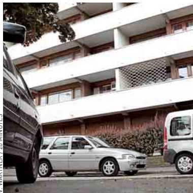
Sur les lieux de l'accident, dimanche.

Cette fois, selon la police, il ne s'agissait pas d'une course-poursuite. « La BAC les surveillait pour faire un flagrant délit », explique une source policière. Lorsqu'ils ont été repérés, le scooter aurait alors fait demi-tour, serait monté sur le trottoir avant de venir « s'écraser contre le flanc gauche de la voiture », poursuit cette même source. Une version contredite par les jeunes du quartier. « Les policiers ont accéléré comme des cow-boys. C'est à ce moment-là