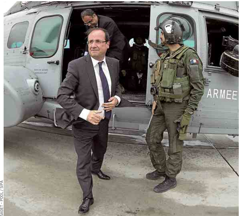
Le 25 mai, François Hollande s'était rendu dans la province de la Kapisa, là où les quatre soldats français ont été victimes d'un attentat, samedi matin.

Surtout, le chef de l'Etat a affirmé que cette attaque n'infléchirait pas sa décision de rapatrier les forces combattantes