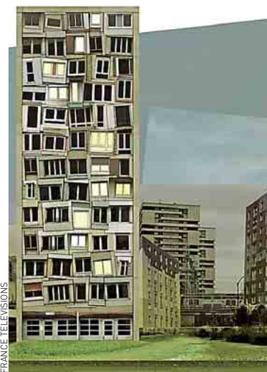
« B4, fenêtres sur tour ».