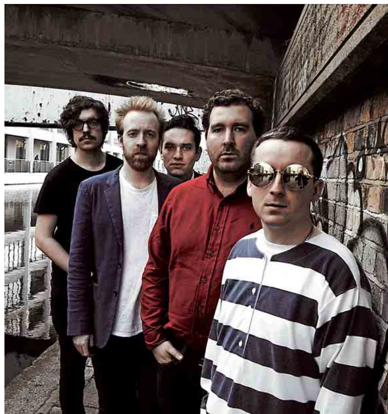
Le groupe anglais d'électro-pop Hot Chip sort son cinquième album.