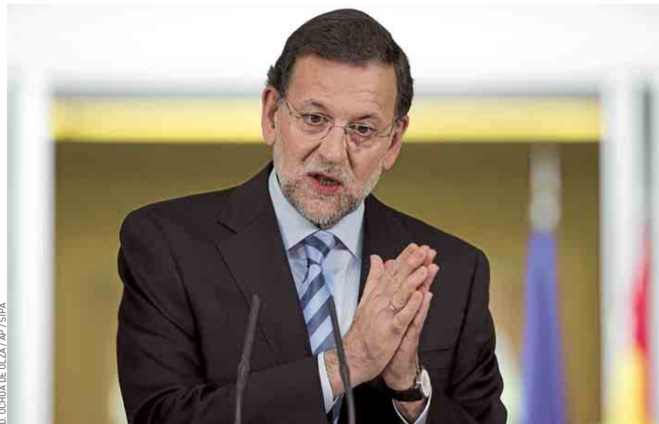
Le Premier ministre espagnol, Mariano Rajoy, lors d'une conférence de presse, samedi.

Avec Madrid, les tractations ont été serrées. Le gouvernement de Mariano Rajoy aurait obtenu que l'Espagne ne soit soumise ni à une intervention extérieure, ni aux mesures d'austérité que subissent l'Irlande ou la Grèce. « Les conditions attachées aux prêts seront imposées aux banques et pas à la société espagnole, pas à sa politique fiscale et économique », a insisté le ministre des Finances espagnol, Luis de Guindos. « Si nous n'avons pas fait ce que nous