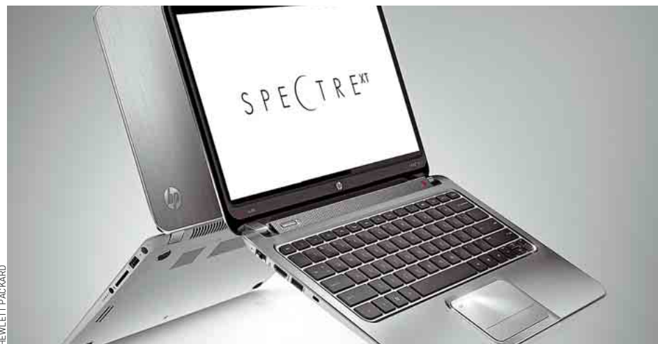
Le Spectre XT de HP, un ultrabook de 13" et 14,5 mm d'épaisseur.

Prix des joujoux : de 599 € pour l'Inspiron 14Z que Dell sortira en juillet à 1 400 € environ pour