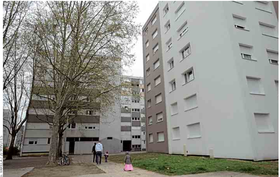
Au cœur de la maille Jacqueline, le passage devrait être baptisé chemin Robin des Bois.