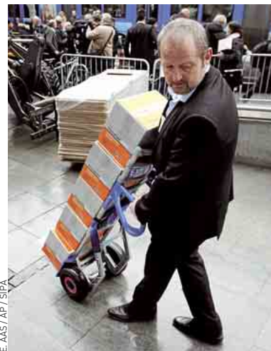
Le dossier judiciaire de Breivik.

Anders Breivik a fait savoir par son avocat qu'il voulait être reconnu « pénalement responsable » pour ne pas invalider les thèses publiées dans son manifeste une heure et demie avant les attaques. Intitulé « 2083, A European Declaration of Independence », ce texte de 1 518 pages exige « la déportation de tous les musulmans hors d'Europe » pour l'année 2083 afin de pouvoir préserver la « chrétienté ».