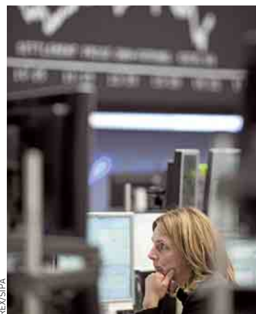
Le produit permet d'acheter des obligations émises par l'Etat français.

Ce contrat permet en fait aux investisseurs qui ont déjà acheté de la dette française de minimiser les pertes en cas de baisse. Ce n'est pas une nouveauté : ce produit existe pour les titres souverains de l'Allemagne, du Royaume-Uni ou encore des Etats-Unis. L'avantage,