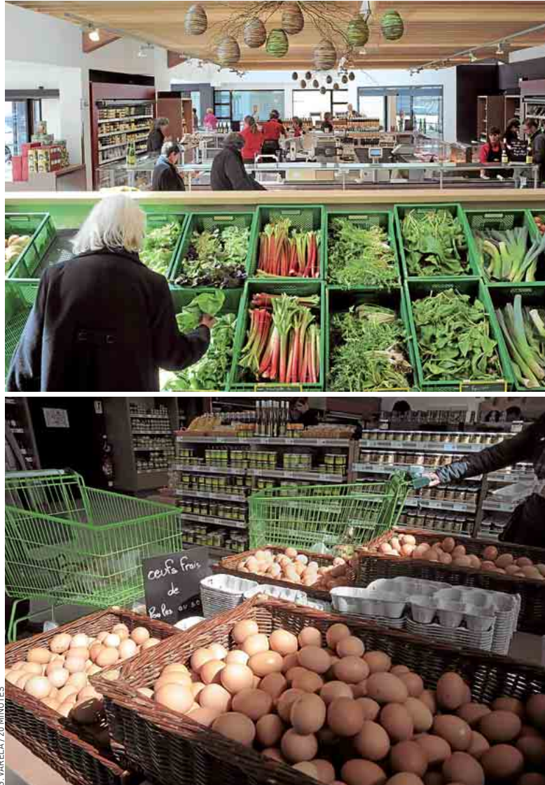
Dans les rayons d'Hop'la, seuls les produits frais et de saison sont proposés.