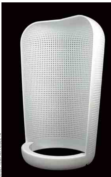
La lampe Katiska, Particule 14, 749 €.

du Salon international du meuble de Milan, qui ouvre ses portes demain, pour mettre en avant son application iPhone-iPod-iPad gratuite. Celle-ci permet à chacun de customiser, sur l'écran de son mobile ou de sa tablette, toute une galerie d'objets créés par des