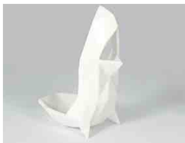
Zozio, Particule 14, 59 €.

signers de renom, tout en y ajoutant sa touche personnelle en relief : son nom sur une coque iPhone, mug ou vase personnalisés avec une silhouette en profil... Unique, original et étonnant. Les prix varient selon la taille de l'objet et le matériau choisi. ■ CHRISTOPHE SÉFRIN