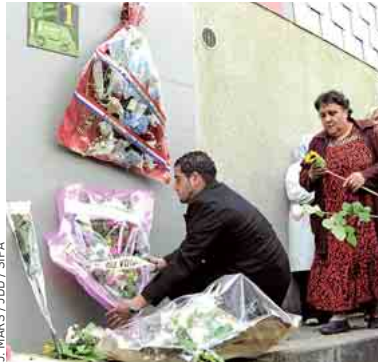
Un hommage à l'une quatre des victimes, à Grigny (Essonne).

Si les gardes à vue des deux suspects arrêtés samedi à Ris-Orangis (lire encadré), dans l'Essonne, et à Paris ont été prolongées dimanche de 24 heures, l'affaire des quatre meurtres de l'Essonne a connu un épisode polémique. « Concernant la première des gardes à vue, j'accuse la Place Beauvau d'avoir prévenu la presse avant même les deux juges d'instruction », a confié à 20 Minutes Matthieu Bonduelle, président du Syndicat de la magistrature. « De nombreux éléments se sont retrouvés dans la presse, sourcés explicitement du ministère de l'Intérieur. C'est une violation manifeste du secret de l'instruction. » Selon lui, la manœuvre a une visée électoraliste : « On cherche à s'attribuer les bénéfices d'une enquête complexe, avant même qu'elle ne soit achevée. Au risque de la saboter. » ■