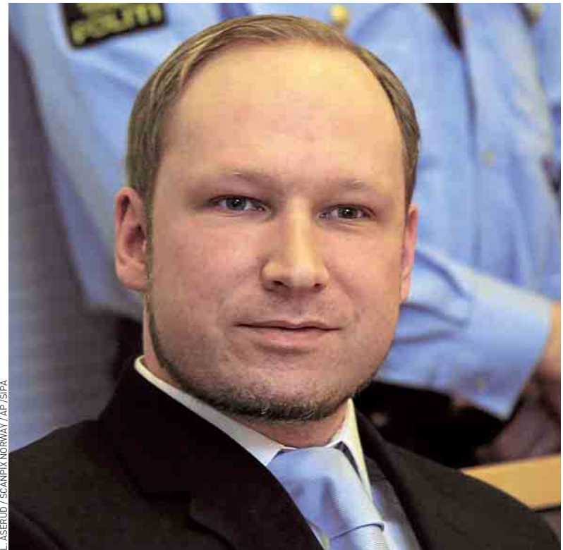
Être pris pour un fou, l'« humiliation ultime » pour Anders Breivik (archives).

Lors des premières audiences de procédure, Anders Breivik avait demandé à comparaître devant les juges en uniforme militaire ou en queue-de-pie. Mais, dans le même temps, il a toujours affirmé être parfaitement lucide. Depuis sa cellule spécialement aménagée, il a même écrit aux médias norvégiens qu'il considérait comme « l'humiliation ultime » le fait d'être pris pour un fou. Difficile de savoir qui se cache derrière