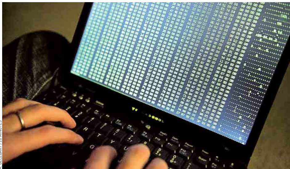
Le quotidien d'un hacker, spécialiste de la sécurité informatique, c'est coder pendant des heures.

Je faisais du forensic , de l'expertise judiciaire en informatique. C'est un peu une autopsie sous forme digitale. J'écrivais le code des outils qu'utilisaient les enquêteurs pour traquer des pirates, élucider un meurtre, retrouver des pédophiles.