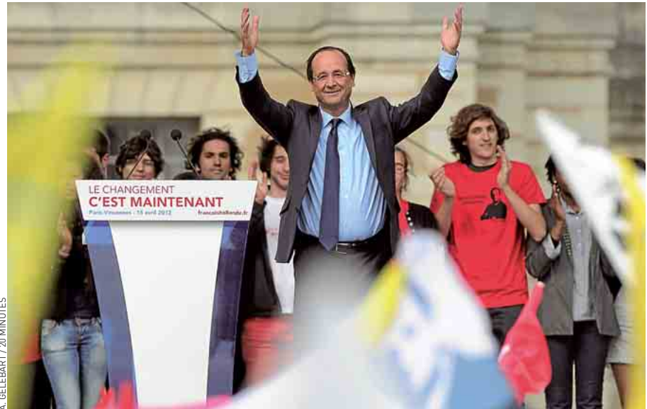
Selon le PS, François Hollande a réuni 100 000 personnes à Vincennes, dimanche.

« Candidat des socialistes, je suis aussi le seul candidat de gauche en mesure de l'emporter. Je demande à ceux qui veulent une autre politique de