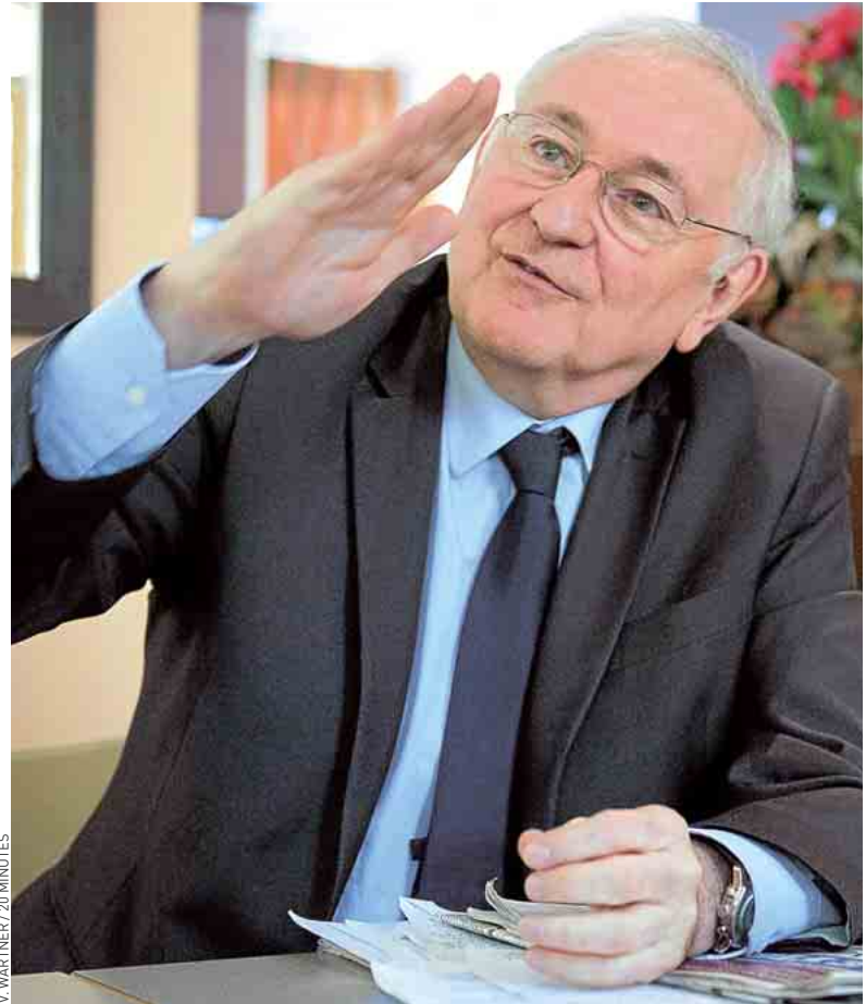
Cheminade veut faire de la Lune « une plateforme pour aller plus loin ».

Non, je ne le suis pas. Ce qui m'ennuie, c'est le manque de discernement de ceux qui formulent ce jugement. Certains ne veulent pas voir que, dans l'histoire, il y a des forces qui agissent à un certain moment pour préserver leurs intérêts.