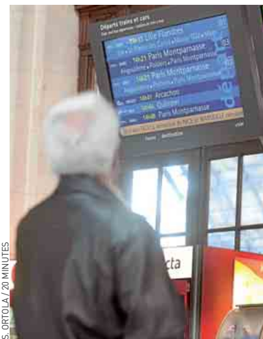
Cent mille cartes Senior à 40 € (au lieu de 57 €) sont mises en vente.

concerne uniquement les déplacements effectués en TGV ou en Intercités, excluant ainsi les TER. Jusqu'au 30 septembre, les seniors pourront également, toujours sur présentation de leur abonnement, profiter de 20 % de réduction sur certains menus du bar TGV, hors IDTGV et TGV Lyria. ■ C.B.