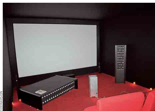
Voir et sentir un film avec la table ou l'enceinte Odoravision.