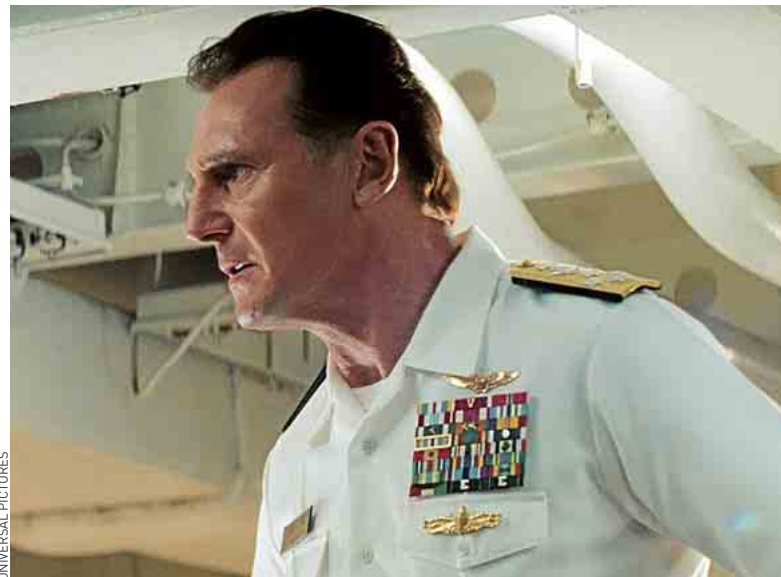
L'amiral Shane (Liam Neeson) va découvrir que l'océan peut être dangereux.

Liam Neeson n'en revient pas : l'acteur irlandais, 59 printemps, est devenu, sur le tard, une star du cinéma d'action comme en témoigne son rôle d'officier intimidant dans Battleship . « Il semblerait que je projette une autorité naturelle qui impressionne mon entou-