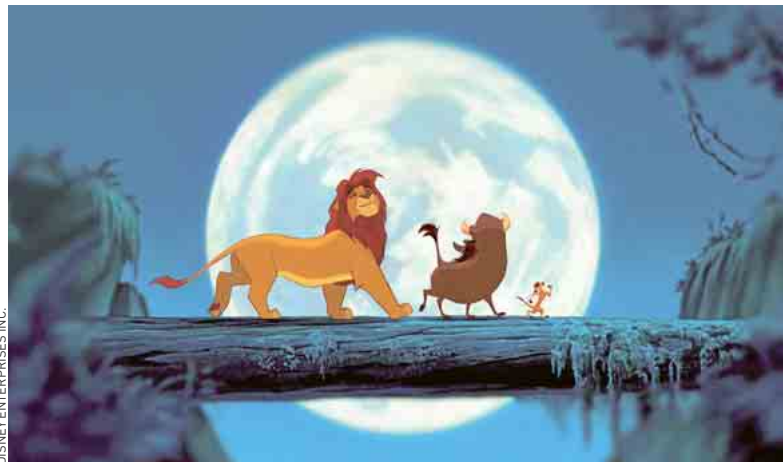
Simba le lionceau et ses amis, Pumbaa le phacochère, et Timon le suricate.