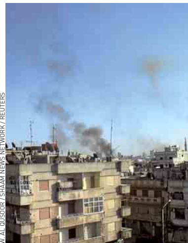
Un quartier de Homs, dimanche.

Pour la France, ces déclarations constituent « un mensonge flagrant et inacceptable ». Depuis la mi-mars 2011, les violences ont fait plus de 9 000 morts, selon les chiffres de l'ONU. ■