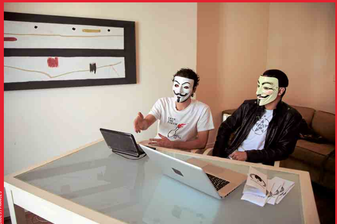
CODE 5 / FRANCE 3

Quelles sont les motivations des Anonymous ? Dans l'émission « Pièces à conviction », diffusée ce soir à 23h15 sur France 3, des journalistes mènent l'enquête sur ce mouvement qui utilise Internet comme toile de résonance.