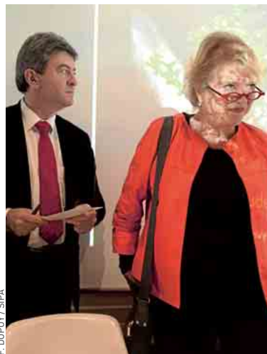
Mélenchon et Joly (archives).