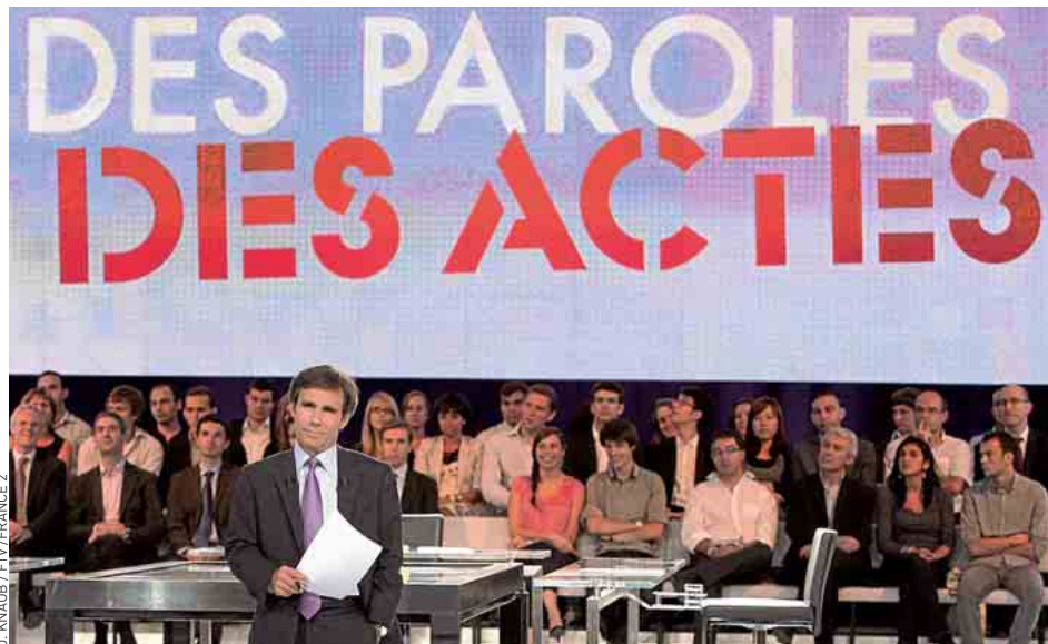
Cinq candidats passeront ce mercredi soir sur France 2. Les cinq autres s'expliqueront jeudi.

semaines pour organiser un débat entre tous les candidats, ce qui aurait été inédit dans l'histoire de la V e République. Mais la chaîne s'est heurtée à la résistance de Nicolas Sarkozy et de François Hollande qui n'avaient aucune envie de débattre avec les autres prétendants. D'où le choix par défaut