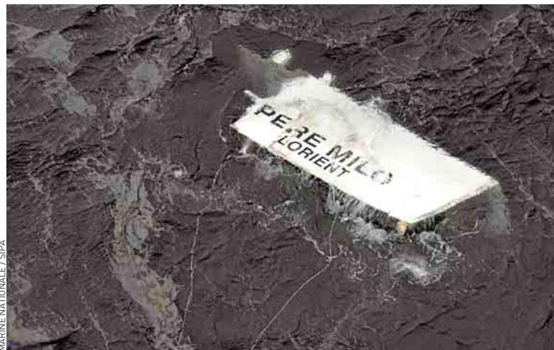
Les circonstances de la collision restent encore à déterminer.

Mardi, le chimiquier turc de 120 m a accepté de se dérouter, à la demande du procureur de Lorient qui a ouvert une information judiciaire pour homicide involontaire. Le navire devait être inspecté au cours de la journée par la section de recherche de la gendarmerie maritime basée à Brest. ■