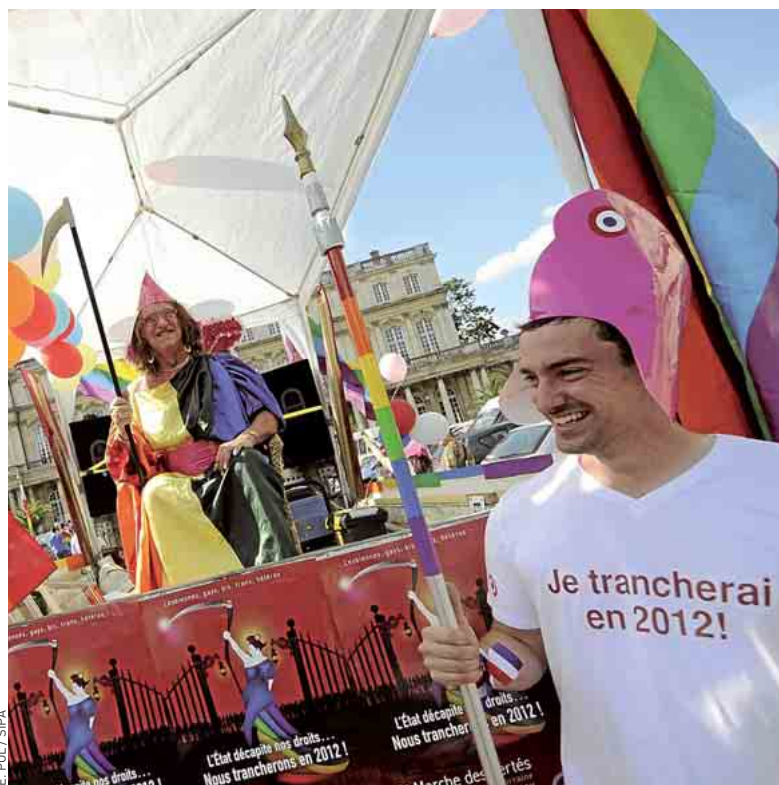
Les gays voteraient autant pour la droite que les hétéros.