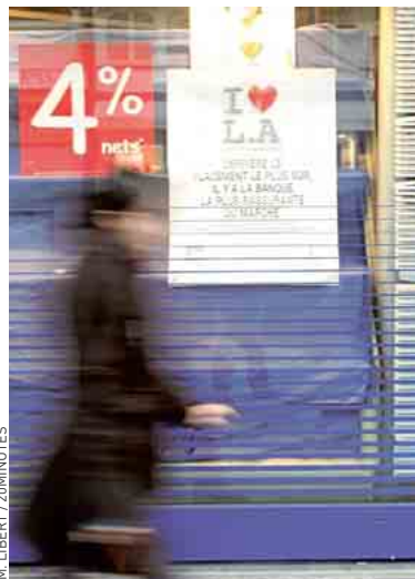
Le Livret A est adapté à tous.

► Vous êtes quadra, en couple, avec deux enfants et 400 € de capacité. Pour la Macif, l'idéal est d'ouvrir un Livret A pour chaque enfant, mais aussi deux livrets jeunes afin d'y faire des versements occasionnels. Elle recommande également l'ouverture d'un PEA, toujours avec versements occasionnels. L'idée étant