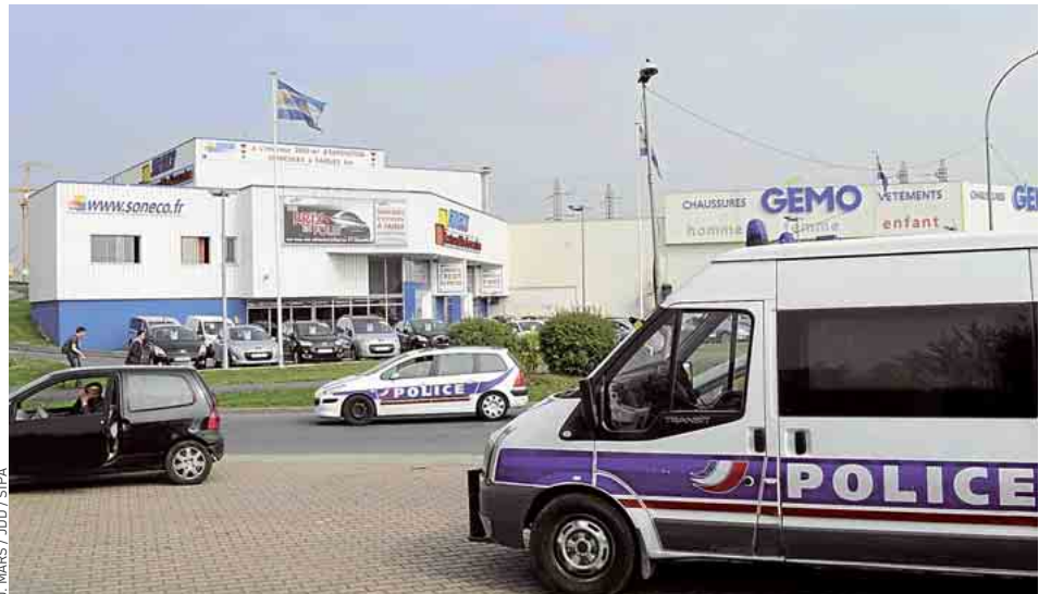
Le dispositif policier mis en place depuis le dernier meurtre dans l'Essonne n'a pas été levé.

Même s'il est officiellement mis hors de cause comme auteur des trois meurtres qui ont suivi, car il était en détention provisoire au moment des faits, les enquêteurs se concentrent sur « ses connexions, sa famille et ses amis ». « Il se peut qu'il y ait dans son environnement proche des complices. Et parmi eux, peut-être le ou les auteurs des meurtres suivants », avance une source policière, précisant que « la sérialité des faits reste une énigme à ce stade-là de l'enquête ».