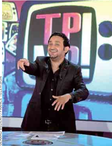
GERARD BEDEAU / FRANCE TELEVISION

Mais non, je suis le premier à le regarder. Mais on n'est pas sur le même créneau. Nous, on est une bande de potes qui ne jugeons pas la télé. On ne dit pas : « Ça, c'est voyeuriste, c'est pas