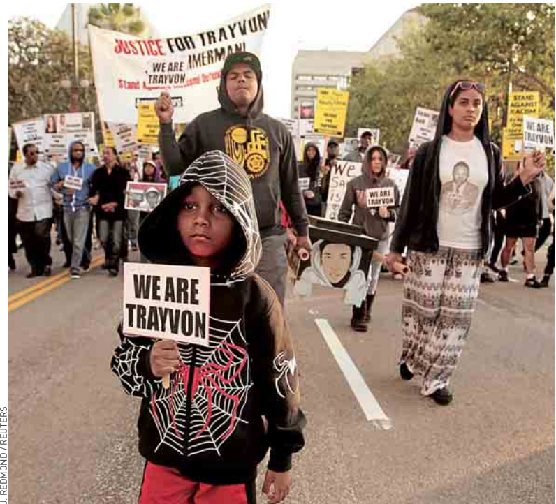
Une manifestation en hommage à Trayvon Martin, lundi, à Los Angeles.

Afro-Américain âgé de 17 ans, Trayvon Martin a été tué le 26 février à Sanford (Floride) alors qu'il rentrait chez son père après être allé à l'épicerie, le visage masqué par sa capuche. George Zimmerman, un Hispanique de 28 ans, vigile de quartier, a reconnu l'avoir tué. Mais les circonstances du meurtre restent floues. George Zimmerman plaide