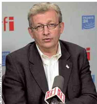
Pierre Laurent (PCF), mardi.

* Paru en février au Seuil, 114 p., 14,50 €.