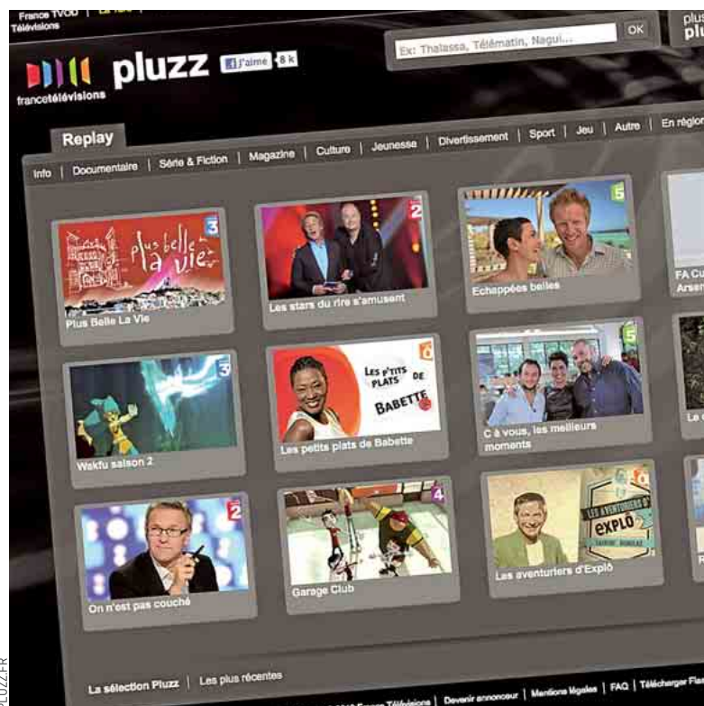
La télévision de rattrapage et la VOD ont bénéficié de la mort de MegaUpload.