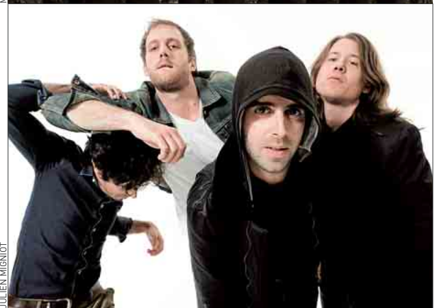
De haut en bas : Skip the Use, Stuck in The Sound.