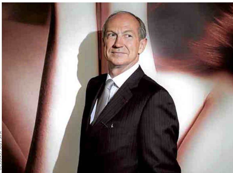
Jean-Paul Agon, le 3 mars 2011 à Paris.

« [Sur les 400 000 stock-options reçues en 2010], j'en garderai 200 000 pour partager une dynamique de performance avec nos actionnaires », ajoute le patron français. « En avril, je proposerai au conseil d'administration l'arrêt total du système de stock-options chez L'Oréal, pour tout le monde et dès cette année », assure-t-il. A la place des stocks options qui profitent à 2 300 personnes du groupe, le PDG du numéro