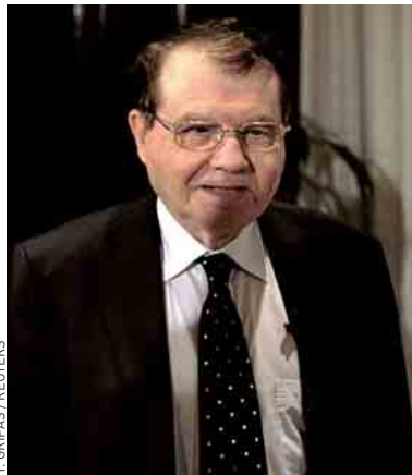
Le professeur Luc Montagnier.

Au point qu'une réunion d'urgence s'est tenue vendredi soir à Genève, au siège de l'Organisation mondiale de la Santé (OMS) en présence d'un groupe restreint d'experts pour répondre aux questions qui se posent désormais : Faut-il rendre publics les résultats de ces manipulations, au risque de donner la « recette » à d'éventuels bioterroristes comme le craignent les autorités américaines qui ont opposé leur veto à toute publication ? Comment s'assurer