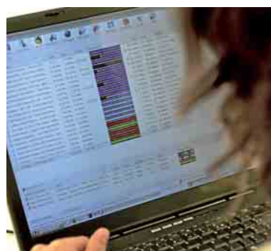
Finies les heures devant l'ordi !

D'après Médiamétrie, près de 98 millions de vidéos ont été visionnées par les internautes français sur Megavideo en novembre 2011. En termes de vidéos vues, le site se classait en troisième position après YouTube (1,3 milliard) et Dailymotion (181,8 millions). Megavideo avait enregistré 2,7 millions de visites uniques sur cette période.